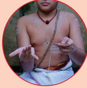
आचमनं - १ आशुमनमं 1