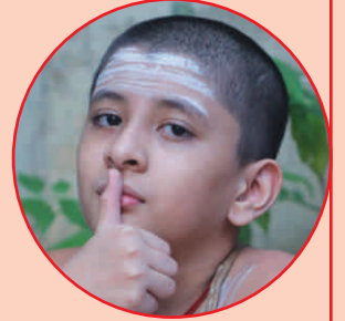
आचमनं - ३ आशुमनमं 3