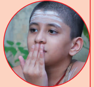
आचमनं - ४ आशुमनमं 4