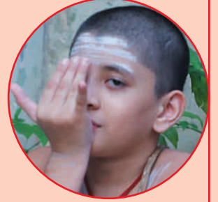
आचमनं - २ आशुमनमं 2